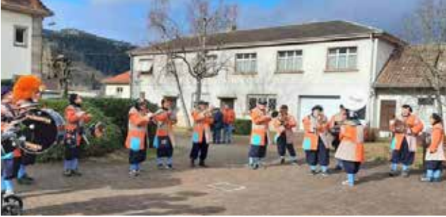
A défaut de cavalcade, la Gugga de l'Espérance a donné une aubade à la Résidence Jungck pour le plus grand plaisir des aînés et du personnel.