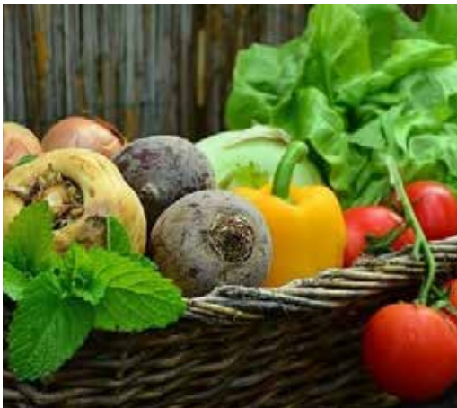
Le partage et l'entraide sont bien des moyens de lutter contre le gaspillage.

Cet été, un panier pourrait être mis à disposition du public à la mairie pour le surplus de production des potagers . Des familles n'ayant pas la chance d'avoir un lopin de terre ou un verger pourraient alors profiter de cette production locale.