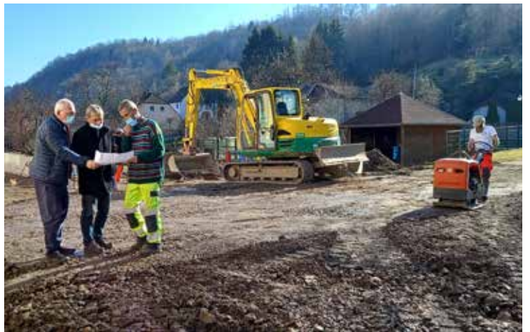
Réunion de chantier dans la cour de l'école maternelle. Le maire et les « techniciens » de la mairie.