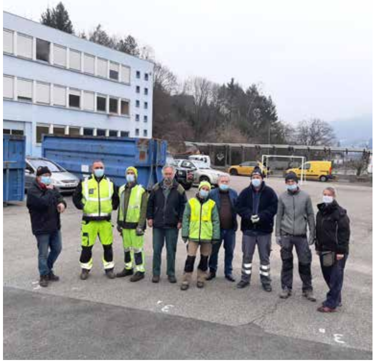
L'équipe technique et les élus au collège de Saint-Amarin pour récupérer du matériel scolaire avant la démolition du fameux bâtiment C.