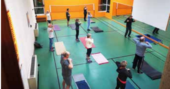
Cours collectif dans la magnifique salle de badminton.