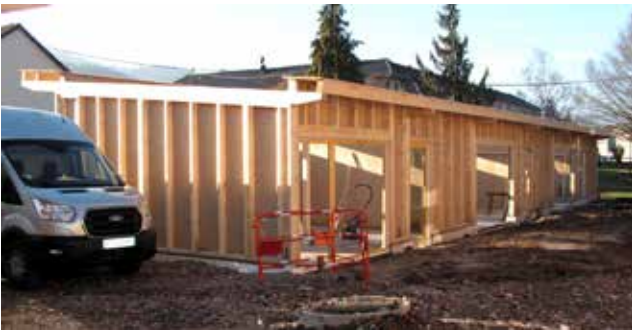
Le chantier du pôle médical avance à un bon rythme. Sans mauvaise surprise, il pourra être opérationnel à l'automne.