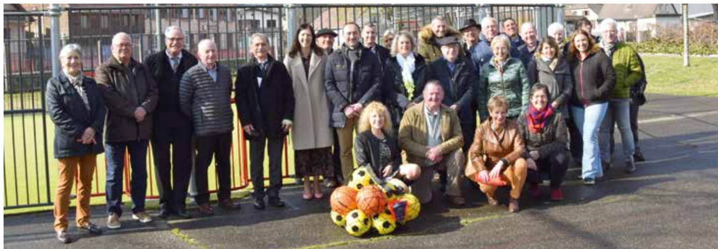
Les participants à cette belle matinée.

Il y a des jours où toutes les planètes s'alignent... Ce fut le cas de cette matinée d'inauguration.