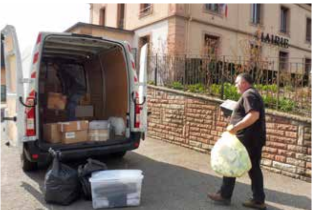
Les élus chargent les dons des mooschois pour l'Ukraine dans le Master Renault mis à notre disposition par le maire de Lutterbach.