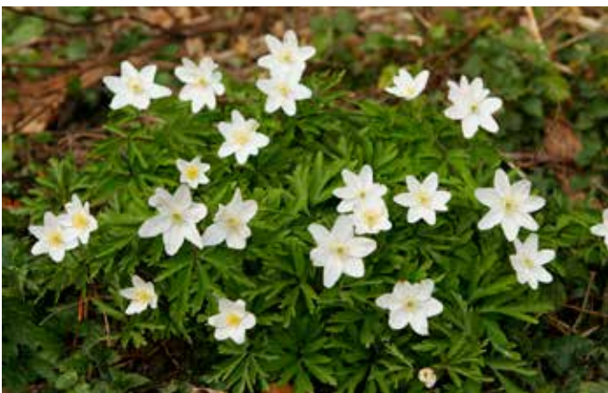
Chacun reconnaîtra les Anémones.

En attendant et pour finir sur une note positive le printemps est arrivé, les petites fleurs commencent à pointer le bout de leurs corolles, les premiers papillons volent et les oiseaux chantent.