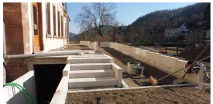
La préparation de la rampe d'accessibilité.