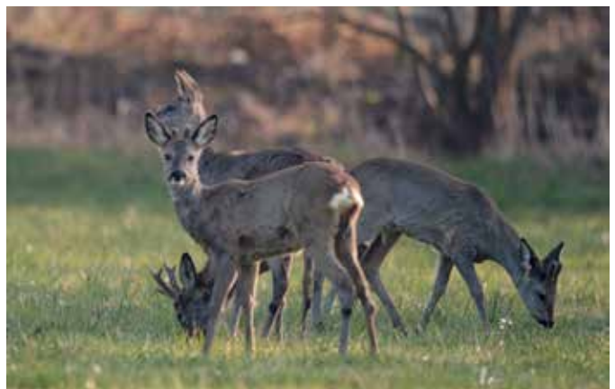
Une famille de chevreuils.