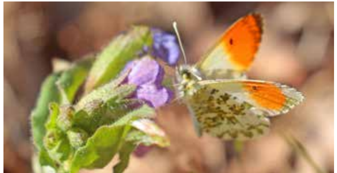
Ces très beaux papillons se nomment Tircis et Aurore.

Une forêt se gère à l'échelle du siècle et plus et bien malin qui pourra dire quel climat nous aurons dans 100 ans... donc savoir par quelles espèces remplacer les actuelles relève