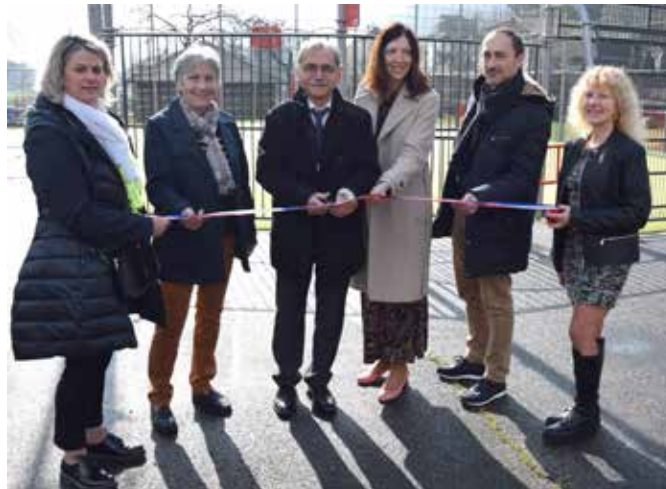
L'incontournable coupé de ruban.

Le maire n'a pas manqué d'adresser ses remerciements aux cofinanceurs de cette belle réalisation, à la Région Grand Est et à feu le Conseil Départemental du Haut-Rhin. La Région nous a octroyé 10 038 euros dans le cadre du soutien aux investissements des communes rurales.