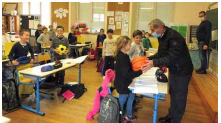
Suite à l'inauguration du city stade, le maire a offert un ballon à toutes les classes de l'école élémentaire. Il en a profité pour distribuer à la classe de CM2 le deuxième numéro du « Petit Gibus ».