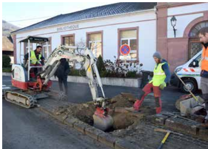
Un trou pour rien, la conduite était nickel!