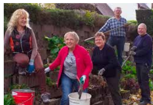
Plusieurs journées ont été consacrées par des bénévoles et des élus au nettoyage du « mur des ainés » près de la mairie. Préparation pour de nouvelles plantations au printemps.