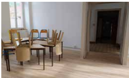
Le centre de documentation de l'école élémentaire refait du sol au plafond.