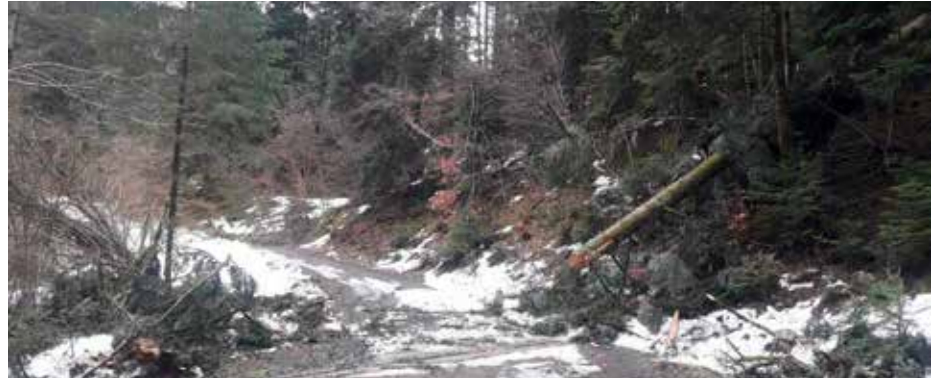
En forêt, l'hécatombe.

Une forêt variée résiste beaucoup mieux aux changements, car il se trouve toujours une ou deux espèces pour prendre le relais en cas de problème, de plus les espèces différentes utilisent