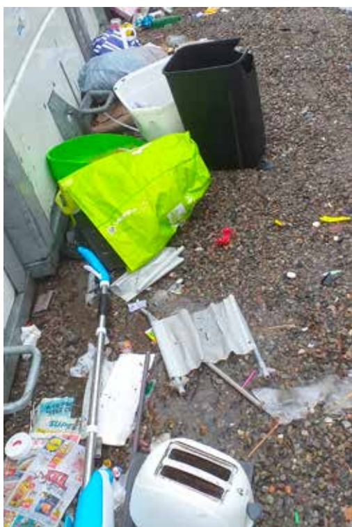
Avec notre immense reconnaissance pour ces cadeaux disparates ! Lamentable !