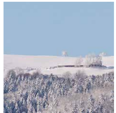
Les crêtes sous la neige.