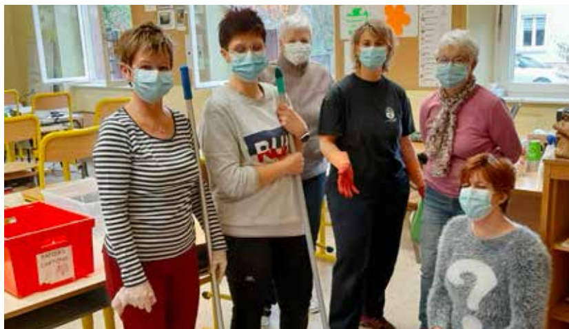
Après les travaux à l'école, le nettoyage ! Merci à l'équipe des élus et des bénévoles.