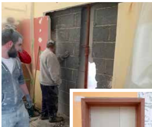
Mise en place d'une porte entre deux salles de classe pour des raisons de sécurité.