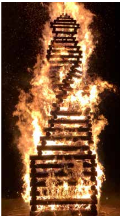
On se souviendra de ce bûcher planté dans la neige et de ces flammes de décembre.