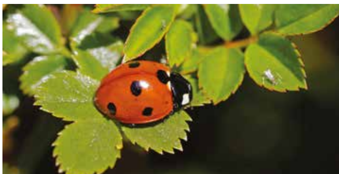
Coccinelle à 7 points

Ci-dessous quelques espèces alsaciennes aujourd'hui très concurrencées par la coccinelle asiatique qu'on a importée dans le cadre de lutte biologique en serre. Malheureusement, elles n'ont pas tardé à s'échapper dans la nature. Très prolifiques, elles tendent à prendre la place des coccinelles locales en les concurrençant pour l'accès à la nourriture. Leurs couleurs sont très variables et le nombre de points va de zéro à plus de 20.