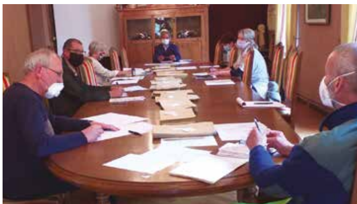
Réunion de travail sur le protocole sanitaire à appliquer dans nos écoles.

ou copines et leurs institutrices. Dans ce dossier comme dans beaucoup d'autres, la collaboration avec la mairie a été exemplaire et mérite d'être soulignée. Nous la remercions chaleureusement et lui souhaitons plein épanouissement professionnel pour les années à venir.