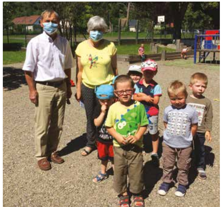
Rentrée des classes le 22 juin à la maternelle.

Responsable de nos deux écoles pendant le confinement, elle a abattu un travail titanesque pour préparer le retour des enfants à l'école. Le 22 juin, 90 % des élèves ont repris le chemin de leur salle de classe , très heureux de retrouver leurs copains