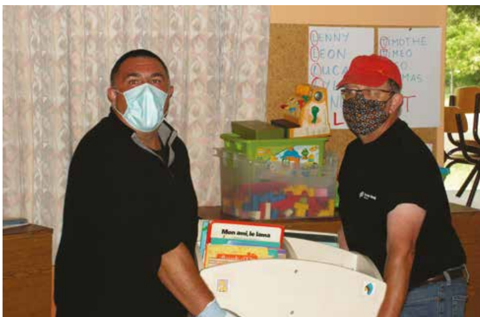
Les élus de retour à l'école

Nous tenons à remercier toutes celles et tous ceux d'ici et d'ailleurs qui nous ont adressé leurs félicitations et leurs encouragements à poursuivre notre action au service de la population.