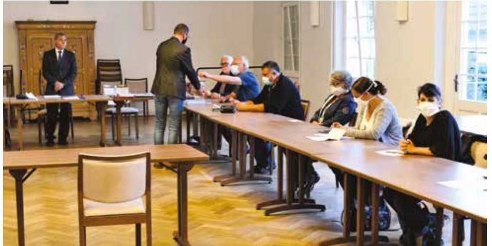
Election du maire et des adjoints.

Encore une fois merci à vous tous. Je compte sur votre engagement au service de la Commune et vous pouvez compter sur le mien, assorti d'un enthousiasme intact. »