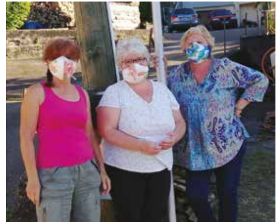
Les couturières de la rue des Fleurs.

Par ailleurs, merci aux couturières émérites qui se sont mises au travail pour pallier le manque de masques dans le pays. Nous nous sommes chargés de les distribuer.