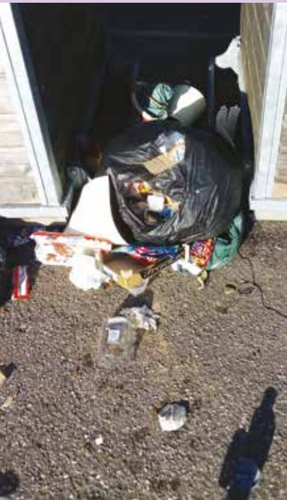
STOP à l'incivisme...

Il va de soi que nous espérons ne jamais devoir recourir à cet arsenal répressif et que nous saurons respecter comme il se doit notre environnement.