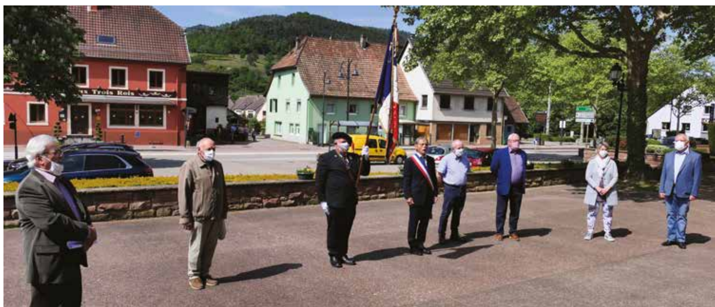
Un 8 mai « minimaliste », mais un 8 mai patriotique.