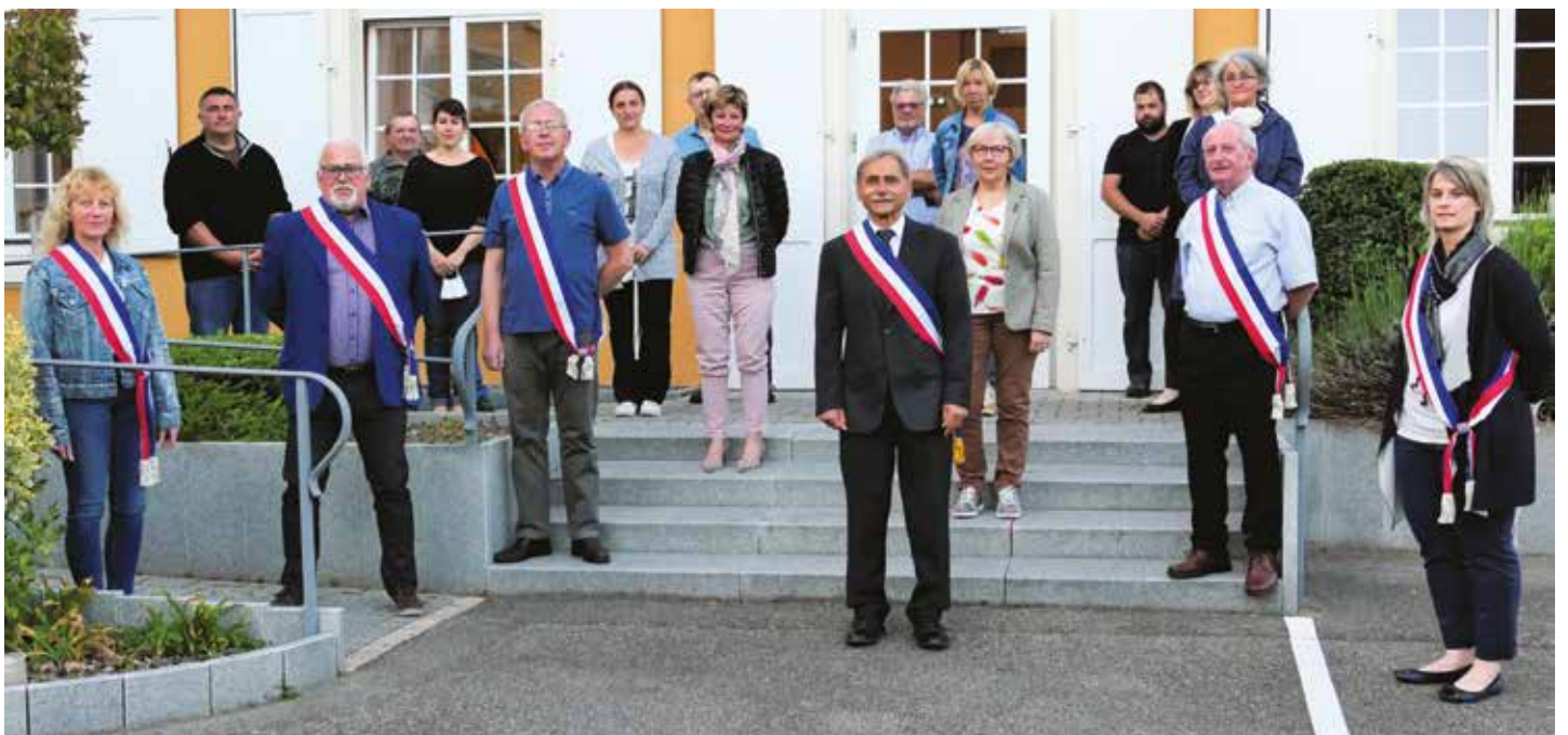
Les élus du Conseil Municipal.

Certains penseront que je radote, j'assume ; la bienveillance doit être notre règle, elle est une vertu, elle est nécessaire au bon fonctionnement d'un groupe. Apprenons à tolérer les défauts des autres, ils toléreront les nôtres.