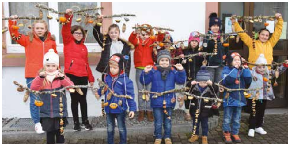
Les enfants et leur guirlande pour les oiseaux.

Dans un fouillis de branchage, cacahuètes et pommes de pin, la vingtaine d'enfants présents aidés par quelques mamans et mamies ont enfilé des noix, des pruneaux et autres friandises pour réaliser de belles suspensions pour les arbres des jardins.