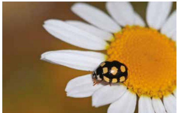
Coccinelle à 14 points

En fonctionnement, les prévisions en termes de coupes de bois sont hautement incertaines . Il nous faudra comme l'année dernière « taper » dans « nos réserves », « l'excédent de fonctionnement » accumulé pendant « les bonnes années », pour payer les factures concernant l'entretien de la forêt et les honoraires de l'ONF .