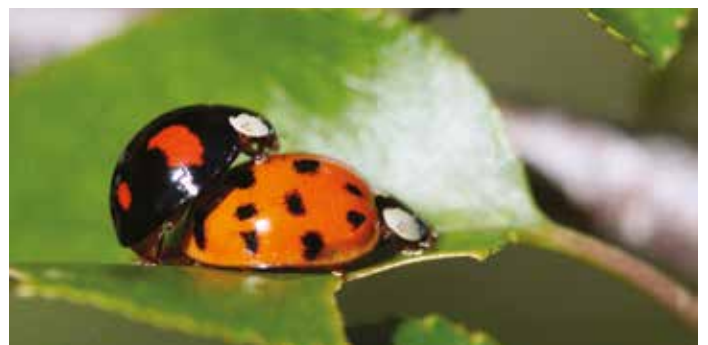
Coccinelles asiatiques envahissantes