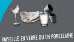
VAISSELLE EN VERRE OU EN PORCELAINE